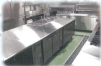
食品工場・飲食店舗