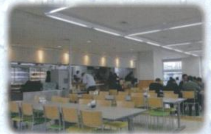
病院施設・教育機関