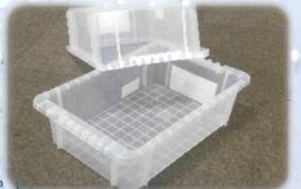
コンテナ、パレット等の殺菌、消臭