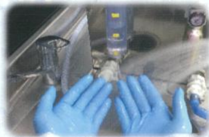
触手による感染対策